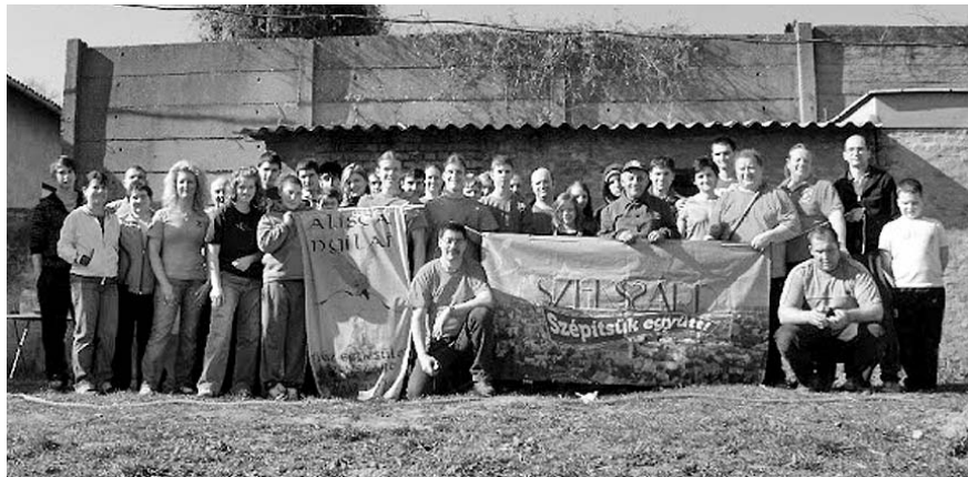
Együtt szépítették Szekszárdot

Tíz tonna használt gumiabroncsot szállítottak el