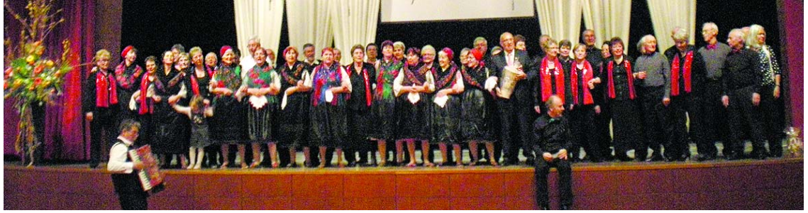
A magyar és a német kórus a jubileumi műsor végén

Németországi testvérvárosunk, Bietigheim-Bissingen kórusa és a szekszárdi „Mondschein” Kórus Egyesület 22 éves kapcsolatuk fontos állomásához érkeztek. A Mondschein 2012. március 15-én indult útnak testvéri szeretettel, új dalokkal és ajándékokkal, hogy méltón köszöntse a jubiláló együtttest 150. születésnapján.