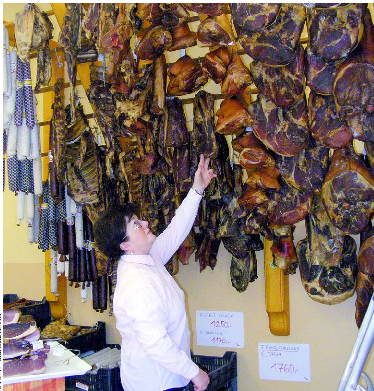
Bőséges kínálat várja a vásárlókat az ünnepek előtt. „Sonkafüggöny” az egyik húszületben