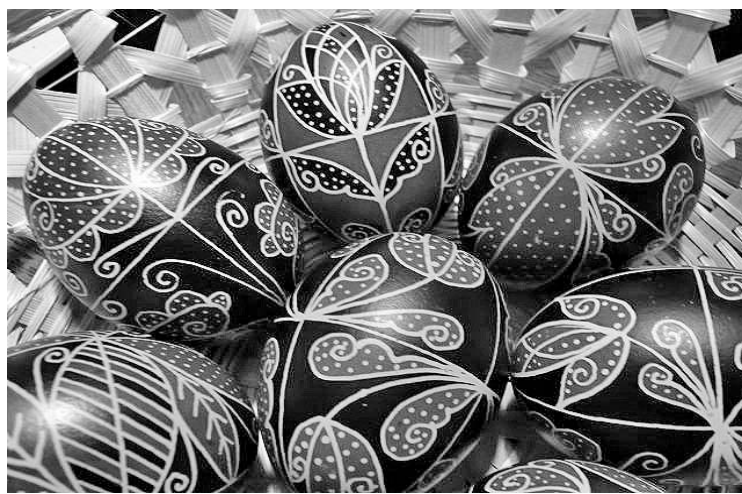
Pulykatojásból készített piros-fekete, eredeti régi mintákkal díszített hímes tojások

tottak, e napot a teljes befelé fordulás jellemezte. Ekkor a leányok fellocsolták a falu utcáját, ezzel a rituáléval várva Jézus visszatérését a Tejúton keresztül. Csütörtökön eloltották a tüzet, amelyet nagyszombaton ismét fellobbantottak, az előző évi barkát pedig leakasztották, paraszat csinálva belőle.