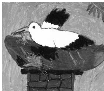
Vörös Martin: Gólyák

A pályamunkákat iskolánként kérjük személyesen leadni 2012. május 7–11. között reggel 8 és délután 16 óra között a Babits Mihály Művelődési Házban (Székszárd, Szent István tér 15–17.). Ekkor lehet-