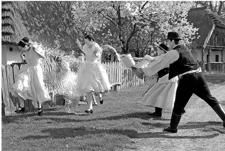
Hagyományörző locsolkodás. Eredetileg termékenységi rítus volt

A nagyböjt titka egyéb, a táplálkozás kívüli dolgokban is az önmegtartóztatást kell, hogy eredményezze a saját lelkünk tisztítása érdekében. A húsvéti ünnepkor ugyanakkor lelkünk feltámadásáról szól. Virágvasárnap a barokszentelésé jelenti, amely Jézusnak Jeruzsálembe, pálmaágas üdvözlés közepette történt bevonulására emlékeztet. A régiek nem vitték be a lakásba a barkát, mert tudták, egyéb bogár is bemehet vele. A barkát két csomóba akasztották fel az ajtóra, amelynek a népszokásban kár- és tüzelhárító hatást tulajdonítottak. Virágvasárnapon háromszor körbe kellett kerülni a templomot, amely fontos funkcióval bírt, hiszen hármassal védelmet (Atya-Fiú-Szentlélek) adott: benne a körbenjárással, a kör-leírásának isteni szimbólumában kiteljesedve védte le a szent helyet a hagyomány szerint. E napon a leányok a főutcán végigvonultak a kapukon támaszkodó legények nem kis öröme.