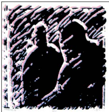
A pokolban nincs idő

Sokszor csak maga a műfaj a kompozíciók címe különféle számozással, egyes munkáknál viszont bókversszerű címek is terelik a nézők gondolatait. A Juar Hero (You are hero – Te hős