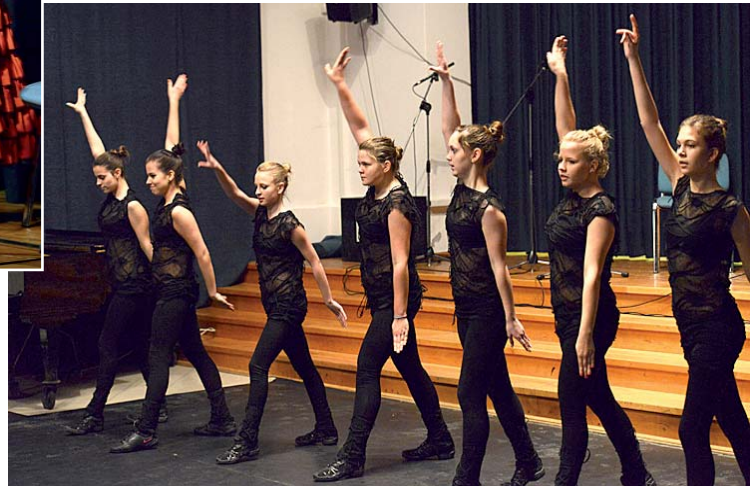
A Modern Mozgásművészeti Stúdió táncosai