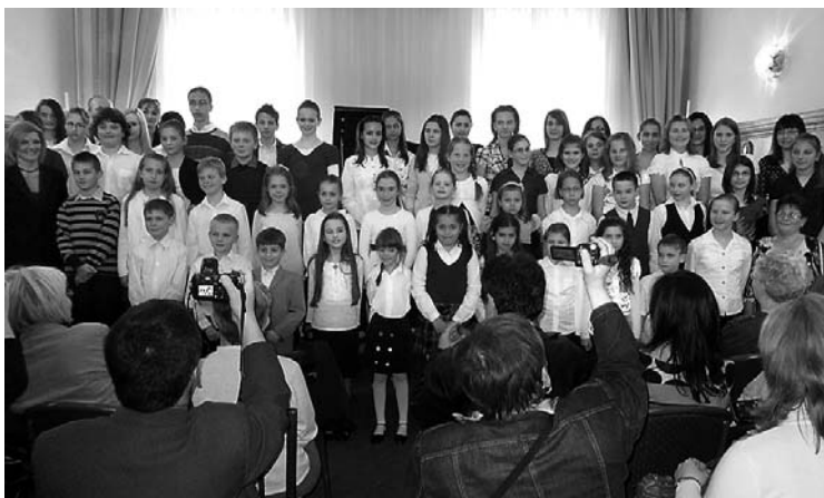
A rendezvény a közösségformálást is szolgálta

adása, melyet sok együtt muzsikálás és gyakorlás előzött meg, meghozta gyümölcsét, mert a két hangverseny nagy sikert aratott a lelkes közönség körében. Nagyon tetszett a gyermekeknek és szüleiknek is a rendezvény, melynek nem titkolt szándéka volt a közösségformálás és az összetartás.