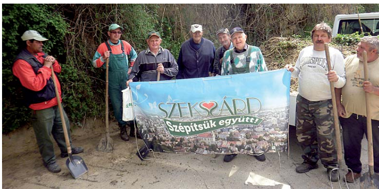
A Sauli-völgyben szőlősgazdák takarították a szurdikot