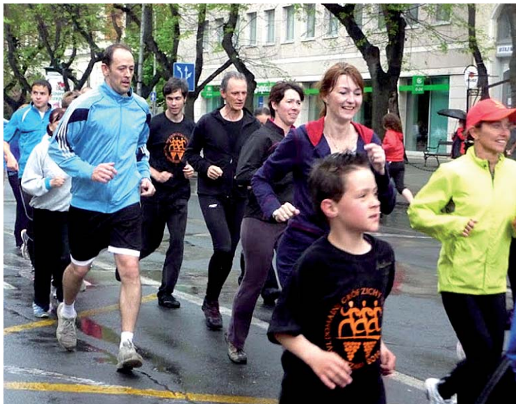
A közkedvelt erőpróba több generációt megmozgatott

Népes mezőnyök az I-IV. korcsoportokban az egy kilométeres illetve a dupla távokon. Óriási hajrák a gyerekek között: ki nyer majd a végén? Dienes, Baka, Babits, Garay, Gyakorló – volt olvasható gyakorta a sűrű rajtlistákon a sok száz benevezett között. No, és a városkörnyékiek a sárközi települések, illetve a völgysegítek általános iskolás alsó és felsőtagozatos tanulói is