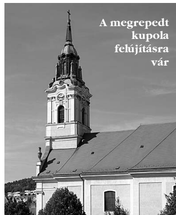
A megrepedt kupola felújításra vár

Köszönjük, amennyiben a tavalyi évben a megrepedt kupola javára is ada-