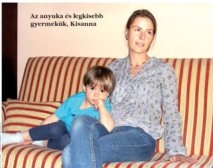
Az anyuka és legkisebb gyermekük, Kisanna

– A biológiai adottságokat és a betegségeket nézve a nőknek csupán egy-két százalékra nem tud szoptatni. Viszont jóval többen vannak azok, akiknek nem