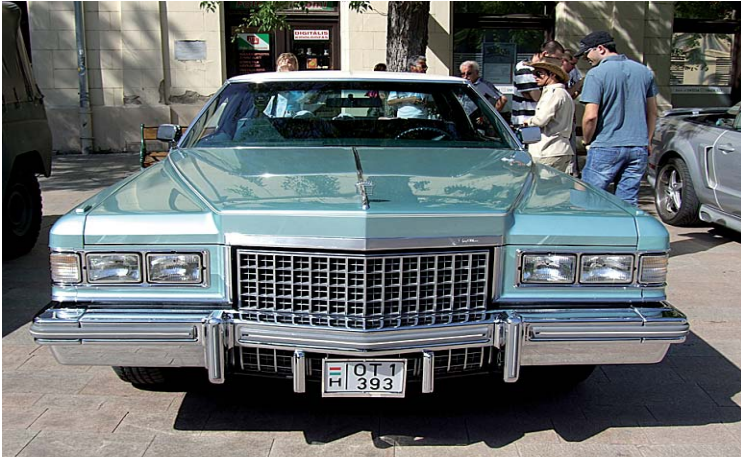
Cadillac Sedan de Ville 1976-ból. Hatalmas tömege biztonságot is nyújt

A tervezés és a műszaki kivitelezés egyik diadalának nevezhetjük a Cadillacet, a világ egyik legismertebb amerikai autómárkáját, amely újításainak köszönhetően sok szempontból úttörőnek számít az autópiacon. A gyártók a műszaki megoldások mellett küllem-