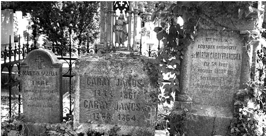
A költő szülei és testvére az alsóvárosi temetőben nyugszanak

Megmentésre vár Garay János költő (Szekszárd, 1812 – Pest, 1853) szüleinek és testvéreinek a sírja.