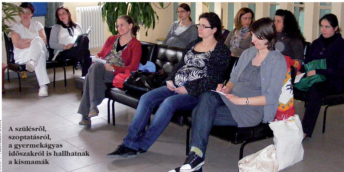
A szülésről, szoptatásról, a gyermekágyas időszakról is hallhatnak a kismamák

– A legegyszerűbb és kézenfekvő példa az éhség észrevétele. A pici babák olyankor szájukba veszik a kezüket, s azt szopizzák. A következő jel a jellegzetes pislogás. Az utolsó éhséjel