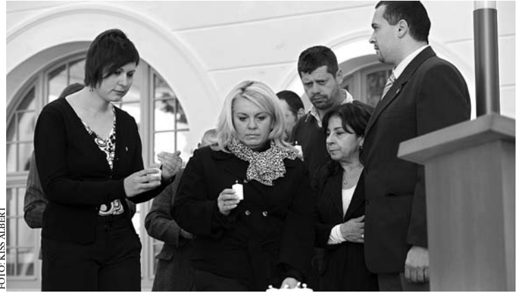
Gyertyát gyújtottak a munkabalesetben elhunytak emlékére