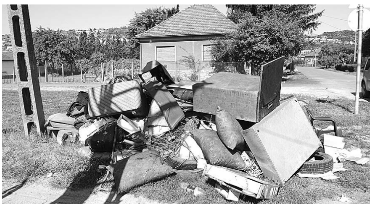
Hogy ne ez jellemezze Szekszárd utcáit