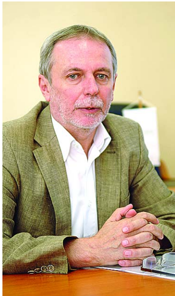
Czerván György államtitkár

Ez egy költségkímélő módszer – mondta az államtitkár –, többek közt azért is, mert hektáronként 20-25 liter üzemanyagot lehet megtakarítani, de nem kevésbé fontos, hogy egyben a környezetet is kíméli ez a módszer.