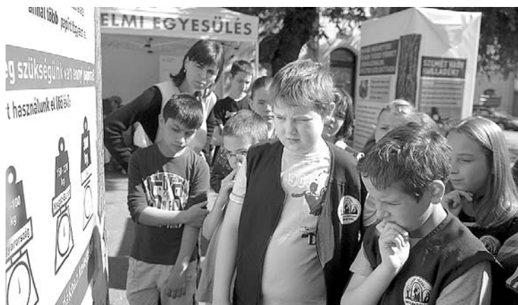
Már gyermekkorban meg kell alapozni a környezettudatos gondolkodást