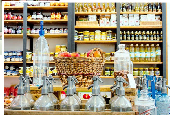
Helyi vagy környékbeli östermelők, kisüzemek termékei a polcokon

– Ez az üzlet szándékaink szerint több lesz mint bolt, inkább intézmény – mondja a házigazda és hozzáteszi: – Azon túl, hogy marketinghátteret nyújtunk a kistermelőknek, és helyi termék védjegy viselését is lehetővé tesszük számukra, kóstoltatásokat, termelő-fogyasztó találkozót, méz-, bor-, hús-, szóda-napokat is tervezünk – teszi hozzá. Hogy környékünkön ki, hol, mit termel, azt megtudhatjuk a fotókkal illusztrált Szekszárd és vidéke – Helyi termék kalauzból, s még ennél is többet a www.szekszarditermek.hu internetes oldalról. (X)