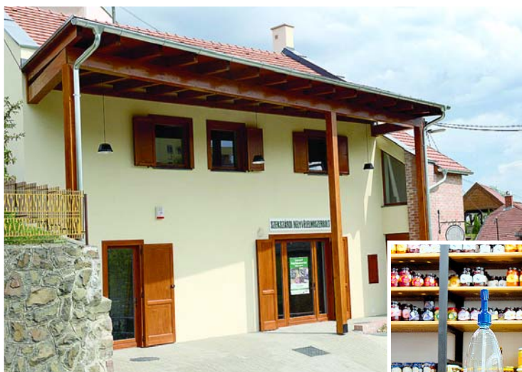
A helyi termékek boltja a Nefelejcs közben

A szombaton megnyílt kereskedelmi egység profilja ugyanis éppen ez: hazai földben, hazai nap által érlelt és magyar gazdák által megtermelt, régi, jól bevált módszerekkel előállított enni- és innivalókat kínálna azoknak, akik szívesebben fogyasztanak lakóhelyükről vagy annak közeléből származó, nem agyontartósított és vegyszerezett termékeket. Ezért az Eco-Sensus Kft. által létrehozott üzletben Szekszárdról, illetve 25 kilométeres körzetéből