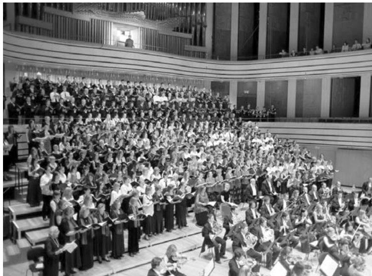
A 400 fős egyesített kórusban ott énekeltek a szekszárdi dalosok is

Az előadás első részben Vajda János Erkel- és Kossuth-díjas zeneszerző zenekarra és énekkarra írott Változatok című műve hangzott el. Két gyermekdal (Bújj, bújj, zöld ág és Száraz tónak nedves partján) közismert motívumaira épül a szerző Szilágyi Domokos „Változatok egy képzeletbeli Weöres-versre” című művét megidéző kompozíciója. Weöres Sándor Szilágyi által továbbjártott szürreális képzetei izgalmasan bontakoztak ki a zenekarra és énekkarra meg- és átfogalmazott zenei variációkban. Nem volt nehéz felismerni a