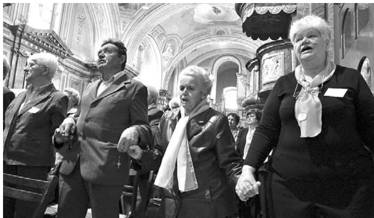
Gyermekeikért, családjukért imádkoztak