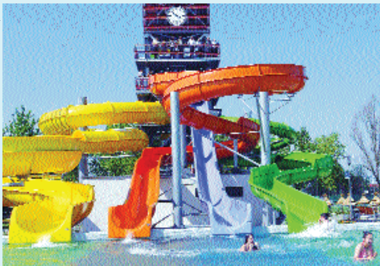
Szekszárdi Családbarát Strand és Élmenyfürdő, Sport utca, a sportosarnok mellett