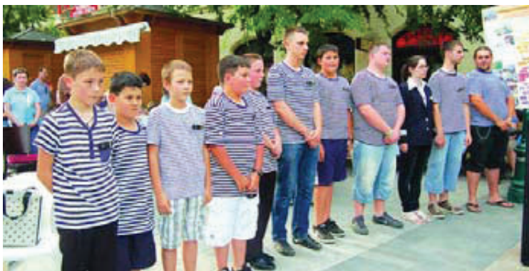
A Clark Ádám Flottilla közösségi díjat kapott