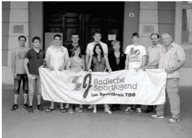
Magyar vendéglátóikkal a szekszárdi városháza előtt

A program összeállításában és kivitelezésében nagy szerepet vállaltak azok a magyar diákok és szülei, akiknek ezen a kapcsolaton keresztül lehetőségük nyílt egy másik kultúra megismerésére és a német nyelv gyakorlására.