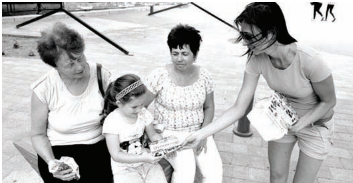
A fiatalok körében az egyik legnépszerűbb nyárimunka a szórólapozás

Évről évre egyre több diák dönt úgy, hogy a szünidőt - vagy annak egy részét - munkával tölti, ezért ismét aktuális a diákok foglalkoztatási szabályainak áttekintése.