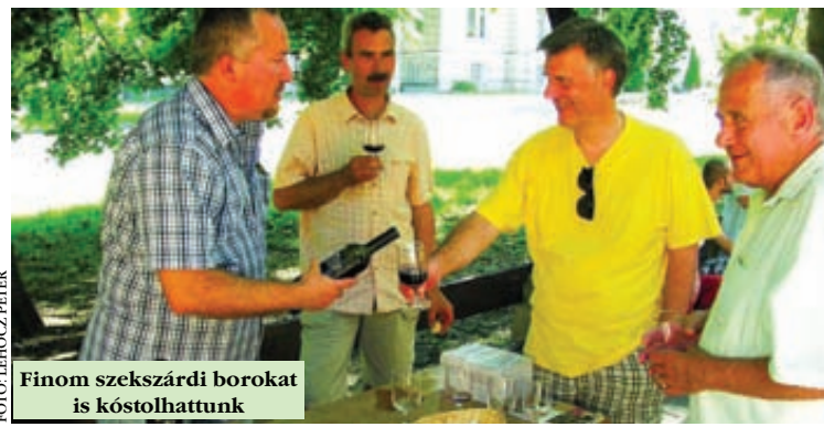
Finom szekszárdi borokat is kóstolhattunk

fős közönséget. Az V. Borok és Húrok Fesztivált a budapesti Mydros görög nép- és tánczenét játszó együttes koncertje zárta, majd kezdetét vette a Múzeumok Éjszakája. Wessely Judit