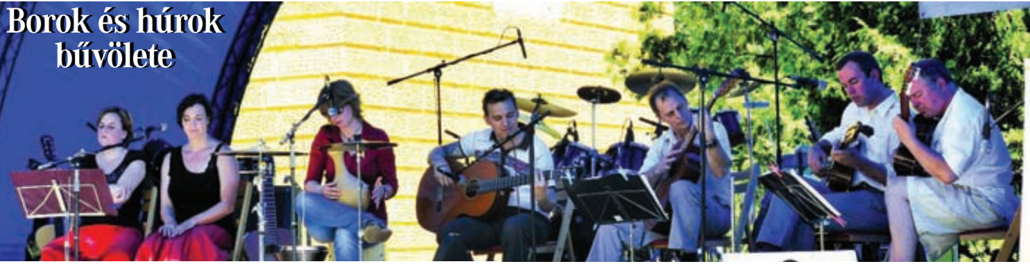
A színpadon a Szekszárdi Gitárkvartett

Több száz érdeklődő, kiváló zene, ízletes borok - három napos volt idén az immáron V. Borok és Húrok Fesztivál.