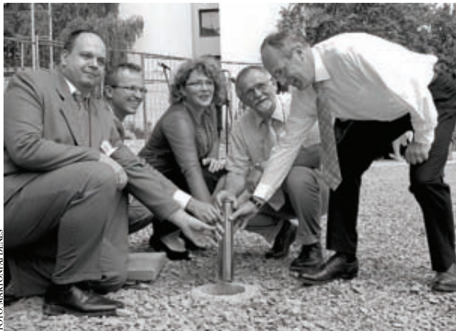
Alapkövetel Szócska Miklós államtitkárral (jobbról)