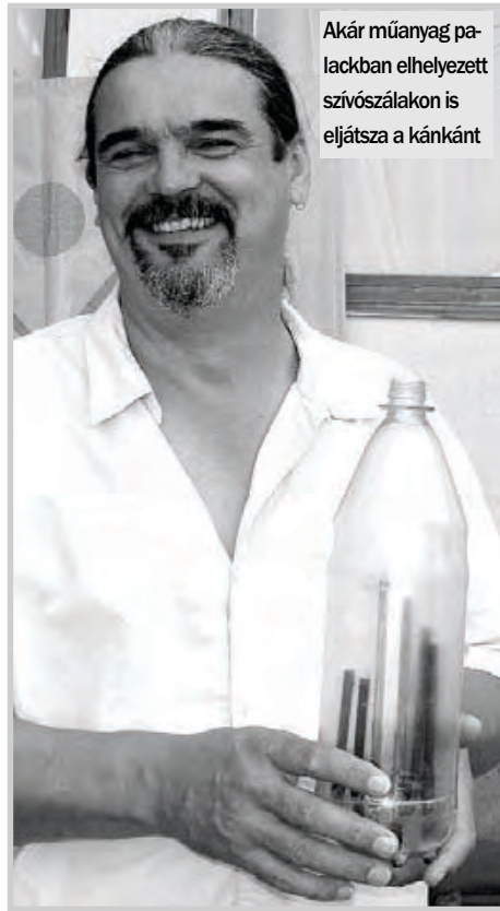
Akár műanyag palackban elhelyezett szívószáלבakon is eljátsza a kánkánt

- A percek alatt elkészülő fúvósok, vagy a többi képesek normális hangon megszólalni?