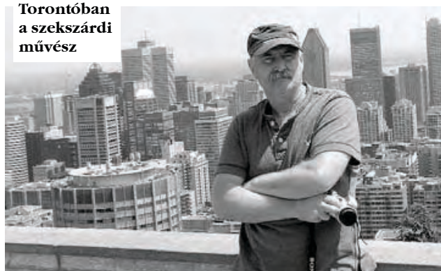
Torontóban a szekszárdi művész

ében, a hazai tárlatokkal együtt, ez volt a hetvenedik kiállítása. Itthon, a Babits Mihály Általános Iskolában tanít rajzot és művészettörténetet. Idestova harminc éve fest, és alkotásait rendre bemutatja. Az előző tárlata Balatonszemesen volt, a következő Esztergomban lesz.