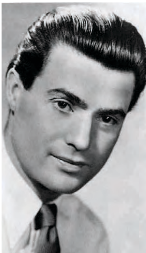
Tolna megyéből indult a népszerű művész

A nagykónyi önkormányzat által a megyei múzeum rendelkezésére bocsátott tárlat nemcsak a szöveges ismertető