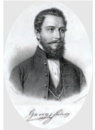
Garay János: KIS MADÁR

Pintyőke kis madár Lánykától megszökött, Ugrál, repül, nevet, A kerti fák fölött. «Várj, várj! megfoglak én!» Szól a lány, s érte mén.