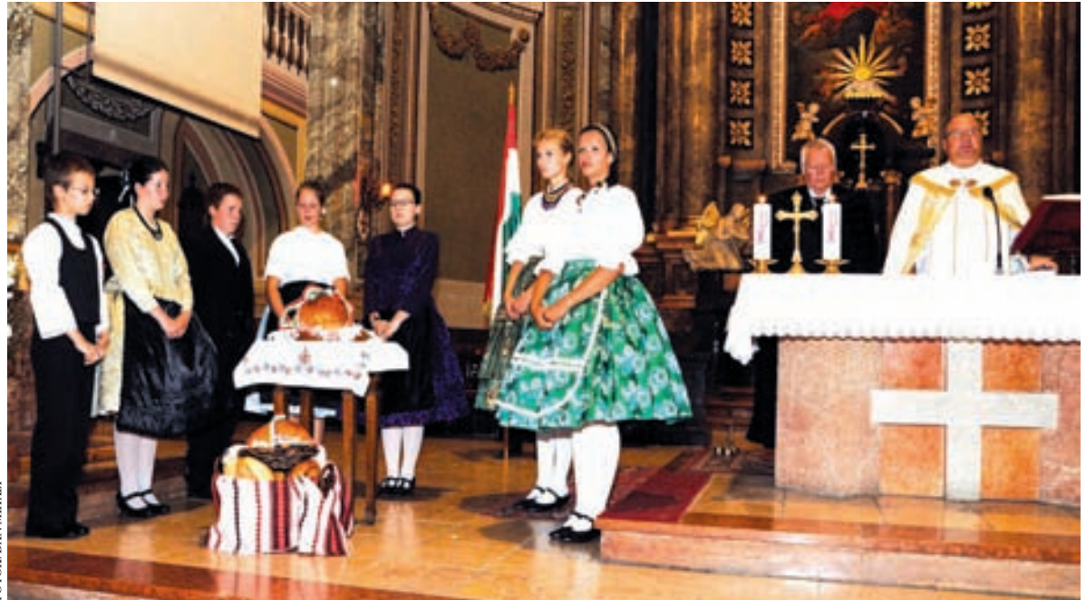
Ökumenikus ünnepi szentmise a belvárosi katolikus templomban