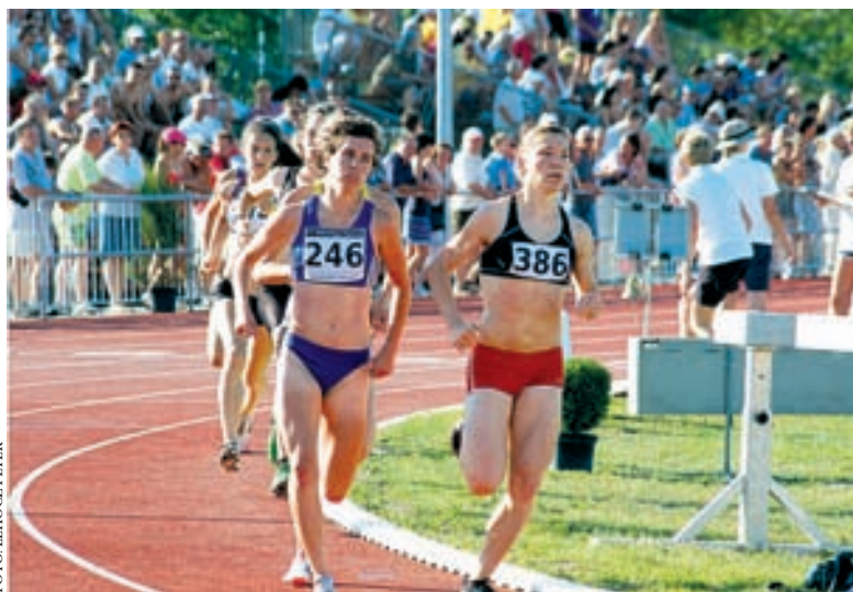
FOTÓ: LEHÓCZ PÉTER

Olyan zsongás várható, mint a legutóbbi felnőtt magyar atlétikai bajnokságon volt, minden szakágban lesz verseny az U-12-től az U-23-ig, reggel 9-től este 9-ig zajlanak majd a versenyek. Futás a 60 méter-től egészen a 10 ezer méterig, közte gát, illetve akadályfutás, rúdugrás, magasugrás, távolugrás, hármasugrás, aztán a dobószámok szinte mindegyike (remélhető-