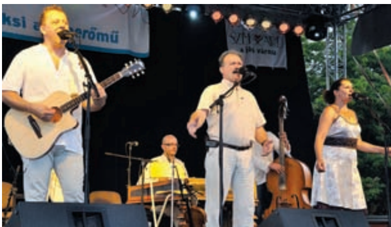
A színpadon a Csík Zenekar

A városi ünnep színpompás tűzijátékkal zárult.