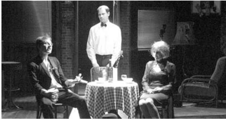
A férfi a Nap összeomlásáról beszélget a lila hajú divával