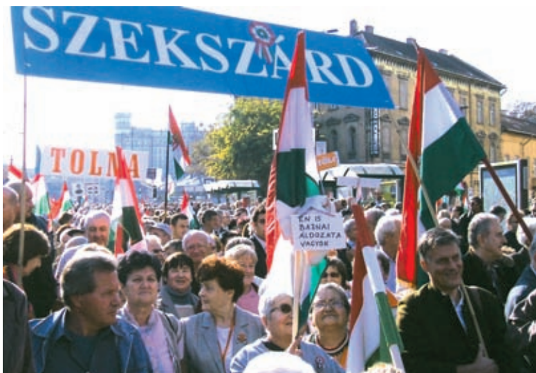
Szekszárdról és Tolnárról is érkeztek szimpatizánsok a Békemenetre

A fővárosi eseményen számos szekszárdi részt vett, de Tolnárról, Fadról, Dunaszentgyörgyről és Paksról is csatlakoztak szimpatizánsok, és megyékből még Bonyhádról és Dunaföldvárról is érkeztek buszok az eseményre. A kellemes őszi időben a menet nemzeti szí-