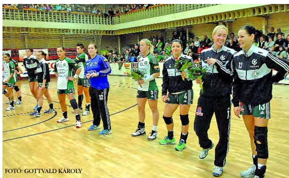
Az Eb-n járt győri klasszissokat virággal köszöntötték

KÉZILABDA. Telt ház előtt játszották december 28-án a Fekete Gólyák KC - Győri Audi ETO női Magyar Kupa nyolcaddöntő a városi sportcsarnokban. A 40-20-as győri sikerrel zárult találkozón a Rábarpartiaknál valamennyi világlklasszis (Haraldsen, Lóke, Lekics, Radicevics, Görbic, Ko-