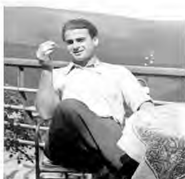
„Aztán – a titok útrakelet, hogy dolgvégéztével ismét öncéli legyen”