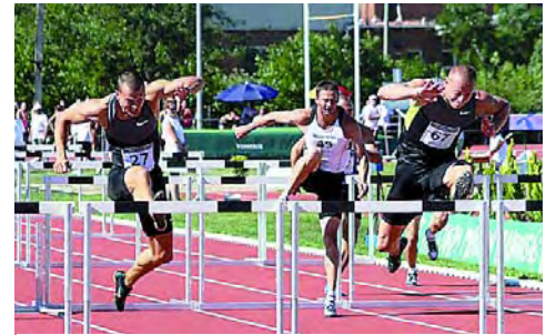
A 110 méter gát döntője a magyar bajnokságon

Az év legrangosabb versenye: a felnőtt Atlétikai Magyar Bajnokság, amelynek 2011 után ismét a szekszárdi atlétikai centrum adott otthont.