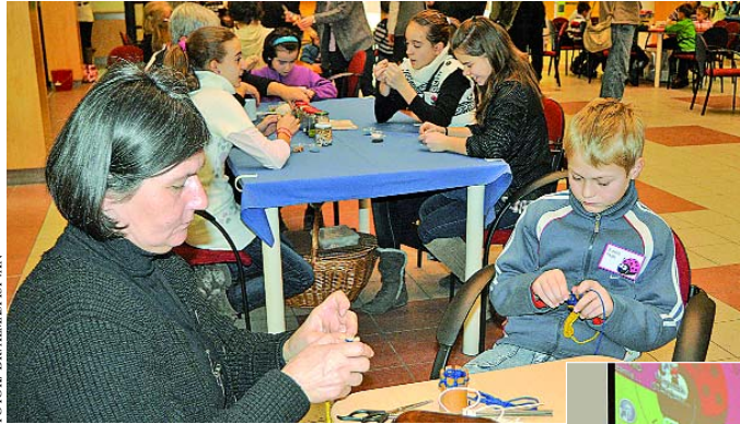
Amíg a szülők a kerekasztal beszélgetésen, addig a gyerekek a kézműves foglalkozásokon vettek részt