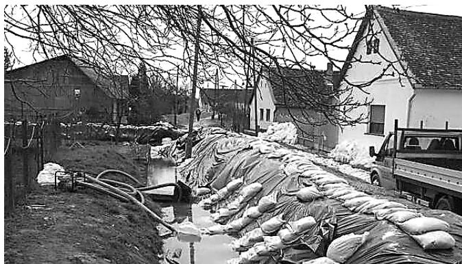
A bátaikat időről időre próbára teszi a Duna tavaszi áradása