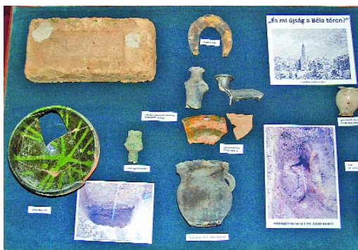
Szekszárd történetéről árulkodó leletek

során: egy sírba temetett két ember karcsonjtjainak elhelyezkedéséből jól látható, hogy egymásba font karral helyezték őket a földbe. Az erről a sírról készült fotó is látható a kamarakiállításán. Ebben a temetőbe, aminek egyes részeit már korábban megtalálták, a kora Zsigmond-korig temetkeztek. Ez az ékszerekből, és az egyik halotti obulusból derül ki. Valószínűleg ezen a környéken állt a település plébániatemploma, de ennek a maradványaira eddig nem leltek rá. Ugyanígy rejtély, hogy hol temették el I. Béla királyt, mivel halálakor az apátság még nem állt. Feltételezhető, hogy először a plébániatemplomba temették, később koporsóját egy előkelőbb helyre szállították. Kozák Károly az apátsági templom 1968-1972. évi feltáráskor nem találta meg a király sírját, minden bizonnyal legkésőbb a török korban feldúlták a templomot.