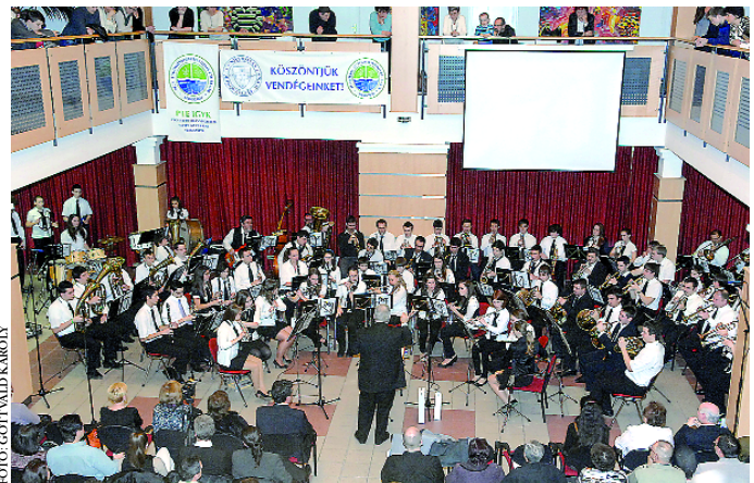
Az Illyés Gyula Kar aulájában adta jubileumi koncertjét a fúvószenekar