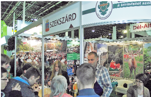
Borkóstoló a Posta Borház jóvoltából

A két város, valamint az őket összekapcsoló, a Gemenc Zrt. által kezelt Gemenci erdő turisztikai kínálatát olyan összefogás keretében mutatják be, melynek lényege, hogy a három partner által biztosított programok, turisztikai szolgál-