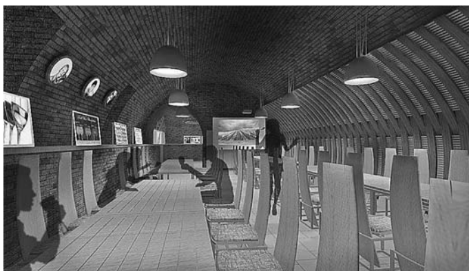
Egy 90 négyzetméteres nagytermet is kialakítanak

A pince felújítására az Új Széchenyi Terv Dél-dunántúli Operatív Programjában pályázott a Szekszárdi Vagyonkezelő Kft., amely a 100 százalékos intenzitású kiíráson 198 millió forint támogatást nyert el.