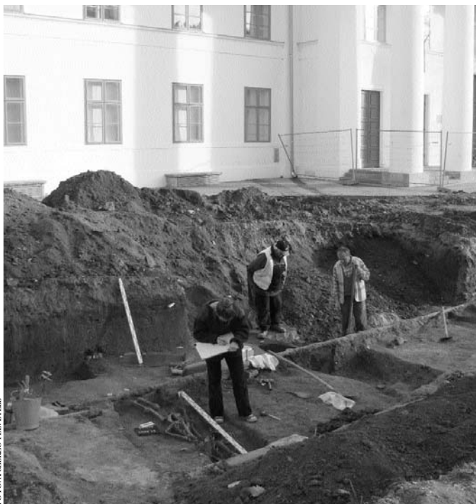
A temető feltárása a vármegyeháza előtt