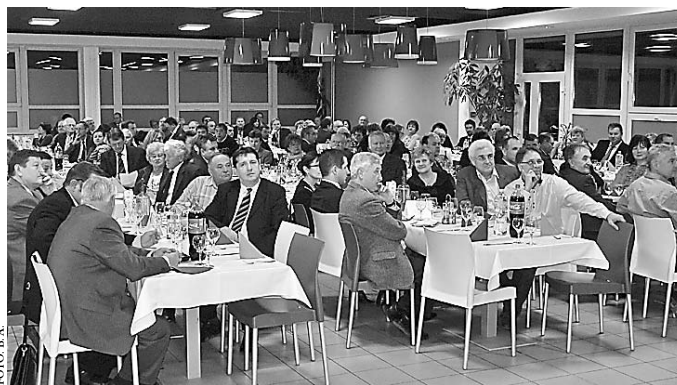
A fórum résztvevői megtöltötték az Illyés Gyula Kar éttermét

A Prima Primiissima díjjal elismert Bogyziszlói Zenekar műsorát követően Ács Rezső számokkal és grafikonokkal illusztrált előadásában a város gazdálkodását vette górcső alá. Az alpolgármester emlékeztetett: a méreteihez képest nagy intézményrendszert fenntartó szekszárdi önkormányzatnak 2010 és 2012 között évente mintegy 4 milliárd forintjába került a dologi és személyi kiadások fedezete. A központi támogatásként kapott pénzeket évről évre egyre nagyobb