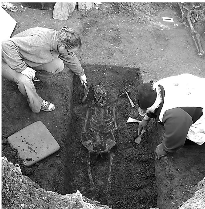
A megtalált sírhelyek feltárása aprólékos munkát kívánt a régészeketől

A város központi részén állt egykori bencés apátság területén az 1930-as