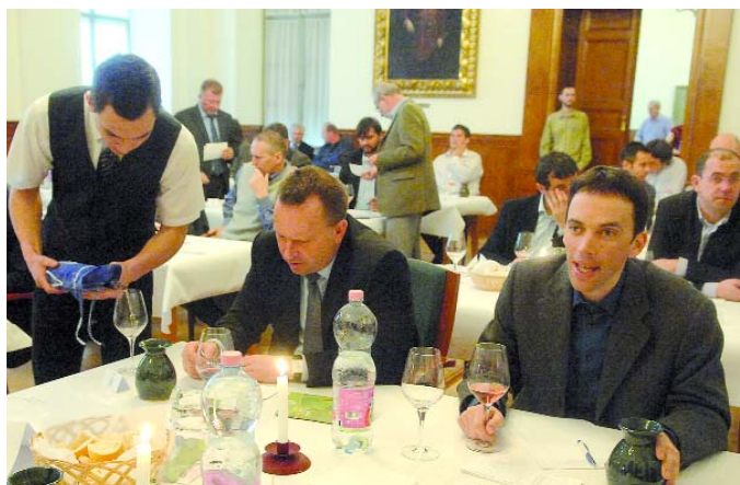
Munkában a zsűri: 212 tételt kóstoltak a borvidéki borversenyen

Többségben voltak a minták között az utóbbi két kiemelkedő évszám, a 2009-es és 2011-es borai. Örvendetes módon a benevezett kadarkák száma megközelítette a harmincat, míg