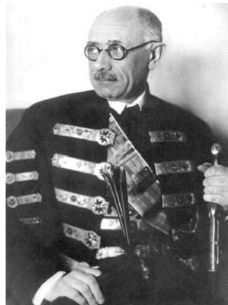
Teleki Pál miniszterelnök

Az előadásorozat első részében a történelemtől arról is értesülhettünk, hogy Teleki már 1918-ban a párizsi békekonferenciára elkészítette a Kárpát-medencéről egy igen pontos, úgynevezett „vörös térképet”, amelyen a magyarság etnikai arányát ezzel a színnel jelölte. A Trianoni diktátum aláírása után, 1921-ben miniszterelnökként és a külügyi tárca vezetőjeként kezdeményezte az elcsatolt területeken élő lakosság etnikai vizsgálatát, amelyre 1924-ben a Magyar Tudományos Akadémián belül működő Magyar Szociográfiai Intézetet hozta létre. Célja volt a Kárpát-medence szociológiai, szociográfiai felmérése, valamint a terület összes településének vizsgálata. A nevével fémjelzett TESZK, vagy „Teleki büro” 1921-től 1924-ig működött, s a határon túli területek intézményeit, diákjait fogta össze, intézeteket, internátusokat hozott létre, s az oktatás és sport területén segítette a fiatalokat, ezen felül a külföldre irányuló magyar propagandát is szervezte. Az 1926-ban szintén általa létrehozott Államtudomá-