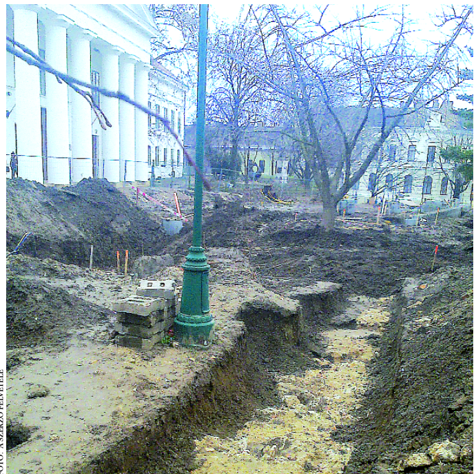
A tér rekonstrukciója során újabb falszakaszokra bukkantak

Az elmúlt évszázadokból néhány említésen kívül csak utazók leírásából tudunk adatokat a várról. Régészeti bizonyítékkal Kozák Károly 1970-ben a vármegyeháza területén folyt kutatásai szolgálták a vár meglétére, amikor is