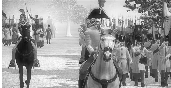
pillanatkép a piski csatát feldolgozó számítógépes animációból