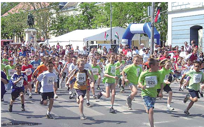
A gyerekek tavaly is nagyon élvezték, hogy övék lehetett a fél belváros

A szekszárdi Sportélmény Alapítvány április 27-én, szombaton immár hetedik alkalommal rendezi meg a Domaine Gróf Zichy utcai futóversenyt.