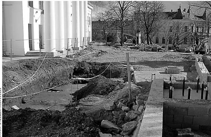
Régi és új. A Béla király téri építkezéssel párhuzamosan zajlik a feltárás

A kényszerűségből megnyitott terület tehát új adatokat szolgáltatott számunkra mind a magyarok története, mind az azt megelőző idősakra vonatkozóan. Nézzük meg most azt is, hogy mi mindenre bukkantunk még a feltárások során. A vár és a város 1545-ben került török kézre. A török a vár területét is bir-