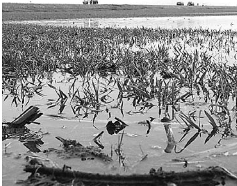
Víz alatt az őszi vetés

A zrt. amúgy a napraforgó kétharmadát már elvetette, és már a kukorica vetését is elkezdték - már ahol lehetett. A Szekszárd Zrt. az országban első között