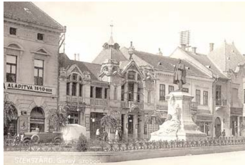
Ballagás a korabeli Garay téren. Szemben a Pirnitzer Áruház és Világ Mozgó képszínház épülete

Az újságból tudjuk, hogy a Garay téren lovak bokrosodtak meg egy gőzgép hallatán, s rohantak bele az Augusztában működő Salamon-féle üzletbe, ahol egy kirakatot rendező alkalmazott súlyosan megsérült. Az 1927-ben alakult Tolna Megyei Mentőegyesület járgánya Bonyhádig és Dunaszentgyörgyig is kiment, ha valakit baleset ért. Ennek az évnek januárjában a Tolna Megyei Nőegylet jótékonyági műsorra készült,