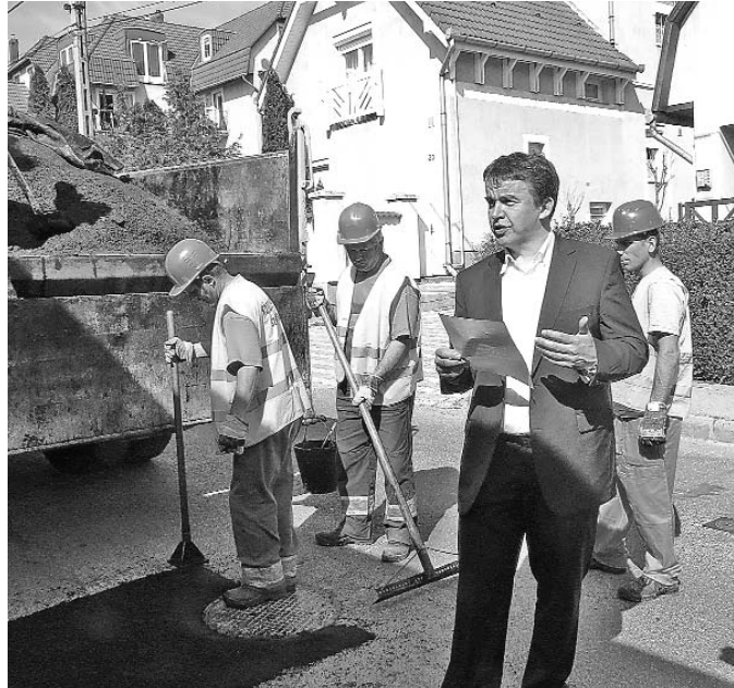
A polgármester ígérte: nem csak a kátyúkat, a járdákat is kijavítják

A Nyár, a Rizling, a Székely Bertalan, a Tormay Béla és a Fürt utca két és fél kilométeren új aszfaltot, szaknyelven kopóréteget kap. A Tavasz és a Szőlőhegyi utcában új út épül, és korszerűsítik a csatornahálózatot is. Emellett a város-