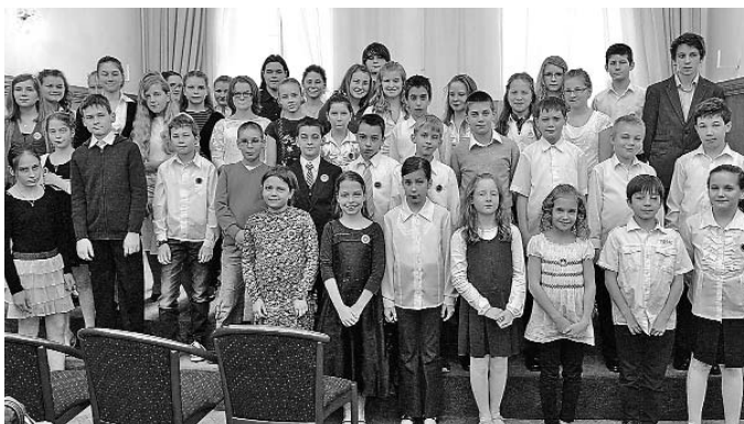
Csoportkép a zongoraverseny résztvevőiről