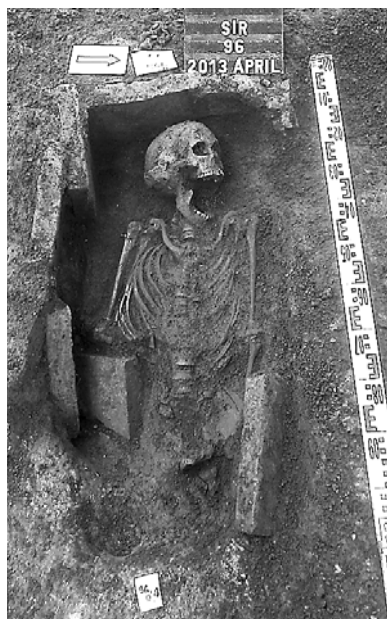
Olyan sírok is előkerültek, amelyek oldalai téglából készültek

A tér arculatát ma is meghatározó épületek a városban 1794-ben pusztító tűzvész után épültek fel. A lángok pusztításának nyomai fekete, faszenes csíkokként voltak megfigyelhetők az árkok metszetsoraiban. Fontos a tér történetében, hogy a tűzvész után, 1802-1805 között épült fel az új templom. A keleti oldalán ázott csapadékvízárók tanúsága szerint ez a hely egy kiemelkedés volt a téren. Az új templom és az egykori vár fala közötti területet feltöltötték, és eltűnt a várfal nyugati oldalán húzódó sáncárok.