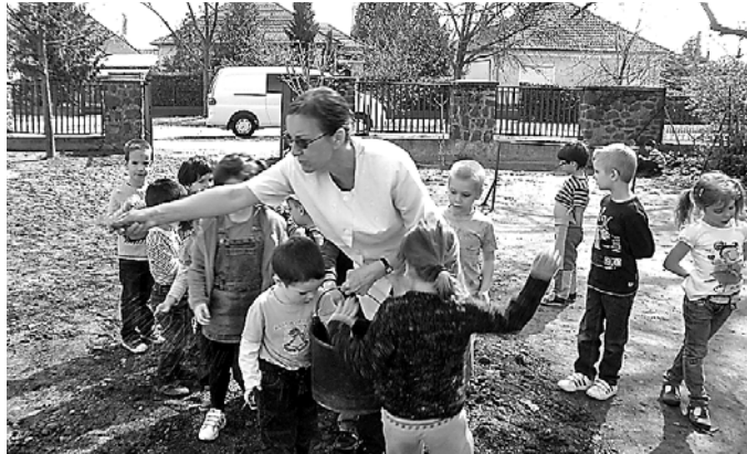
A Kertvárosi ovi apróságai az udvart füvesítették

Egy nappal később a Gyermeklánc Óvoda Kecskés Ferenc utcai Kertvárosi Tagintézményében folytatódott a tavaszi füvesítés. A szülők által már korábban felásott talajba a Dynamic Kft. dolgozta be a szerves trágyát, majd a mintegy 70