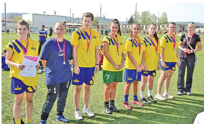
Az egészségügyiek megyei győztes csapata

„Két évvel ezelőtt már eljutottunk lány fociban az országos döntőig - mondta a Baka iskola testnevelő-edzője. Abból a csapatból többen megmaradtak, s tudtunk felhozni ötödik-hatodikos lányokat is. Akik a futsal mellett döntöt-