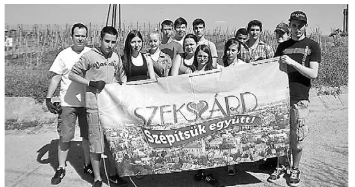
Az I. Béla gimnázium diákjai és tanáruk a Csacska szurdik lábánál