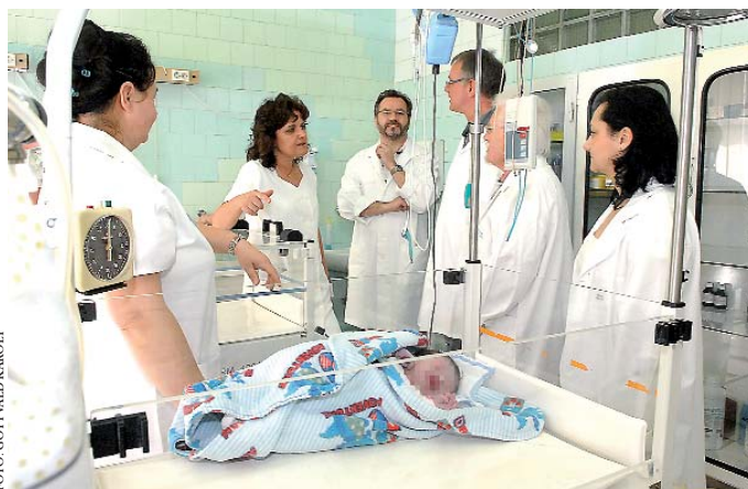
A német vendégek a megyei kórház újszülött osztályán