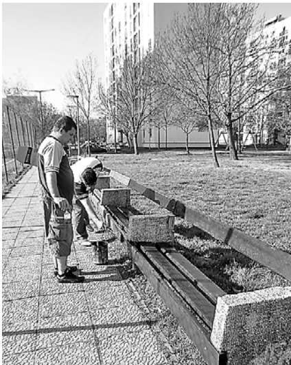
A Roma Hagományörző és Diáksport Egyesület aktivistái kilenc padot festettek le a Gróf Pál utcában

Április 16-án két Alisca utcai édesapa ötletére a lakótömbjük melletti előregedett gyeplétfületet és padokat szépítettük. Felrotálták a területet, magágyat készítettek, elvetették a program által biztosított fűmagot, majd meghengerelték a talajt és azóta naponta locsolják a saját költségükön. A kisgyerekes lakók nagyon örülnek az újításoknak és a padok festése is hamarosan megtörténik.