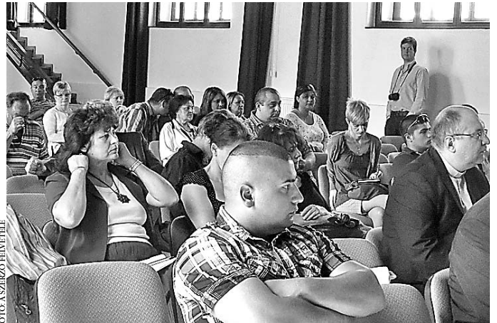
A konferencia hallgatósága a Garay gimnázium dísztermében