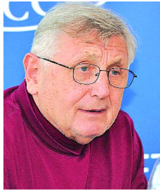
Jiri Menzel az egyetemi karon