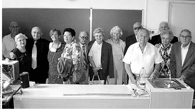
Az öregdiákok és családtagjaik. Az ötvenes éveikben voltak garaysták

„Osztálytársaimmal érettségink 60. évfordulóját ünnepeljük. Ha ugyan ünnep az, hogy megvénültünk és elfelejtettük annak a nagy részét, amit az érettségink még tudtunk. Ezt kár lenne letagadni. Noha sok köztünk a rendkívül művelt, tudós, nagyon értelmes ember, érettségi tételeinket talán egyikünk sem tudná most megválaszolni. (...) Gyerekek, srácok, fiúk, lányok. Ezek maradunk egymásnak mindhalálig. (...) Megtanácskozunk, mikor találkozunk megint? Jövő nyáron! – mondják a pesszimisták. Az optimisták