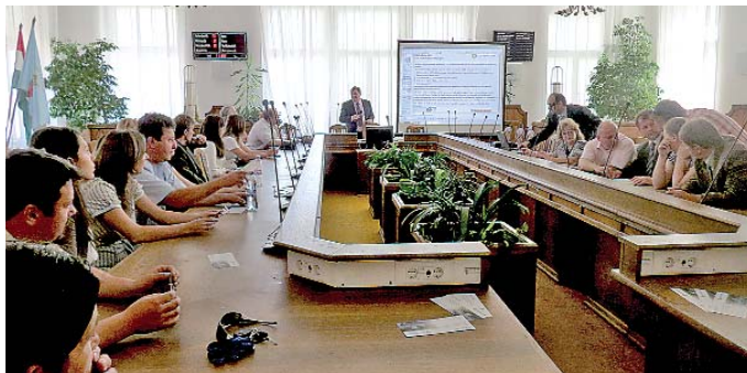
Projektindító konferencia a szekszárdi városházán