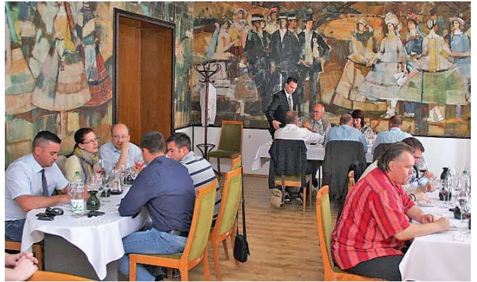
Három bizottság köstölte a tételket a városházán