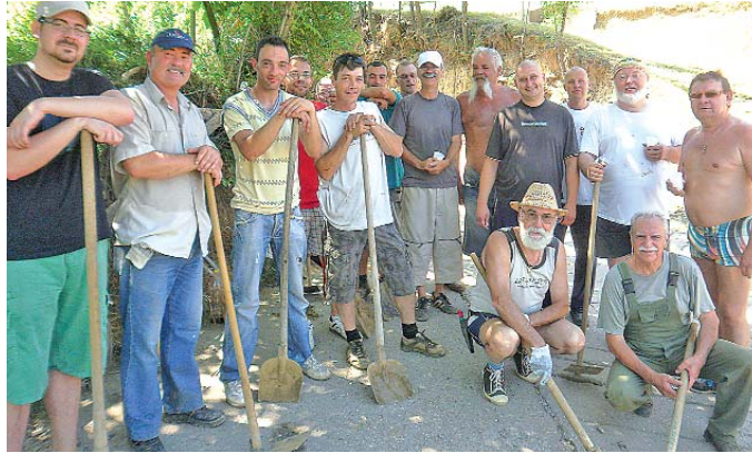
Sokan ragadtak ásót, lapátot a Csacska szurdokban