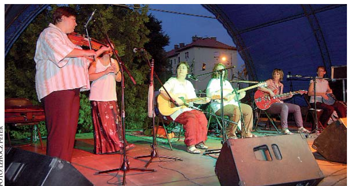
Különleges zenei élményt kínált a fesztivál