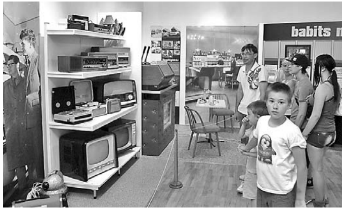
Retro: az idősebbeknek emlék, a fiataloknak történelem

A kiállítóterbe lépve jóleső nosztalgia tölti el a felnőtteket. Ha nem a saját, de a szülei, nagyszülei egykori bútorai, használati tárgyai közül biztos ráismer-