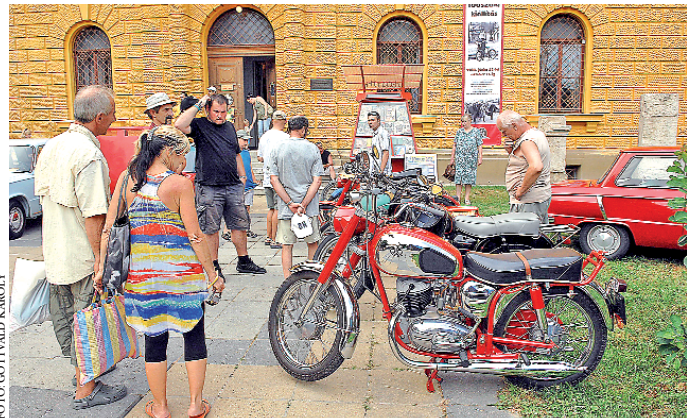
Veterán motorok és autók hívogattak a múzeum új kiállítására

Mintha négy-öt évtizedet visszaléptünk volna az időben. A múzeum előtti téren veterán autók és motorok: Zsigulik, Moszkvics és Zaporozsec, az egykori szovjet ipar remekei, egy csehszlovák Škoda és nyolc, többségében magyar gyártmányú motorkerékpár (Csepel, Pannonia, Danuvia). Ezek mellett egy-egy kelet-német MZt és Simsont is kiállított a Mecsek OldTimer Egyesület, a Veterán Zsiguli Egyesület és az Oldtimer Club Pécs. Az időutazást csak fokozta a téren elhelyezett korabeli hírlapárus bódé, benne régi újságokkal: a Bűvár, a Nők Lapja, vagy a már meg-