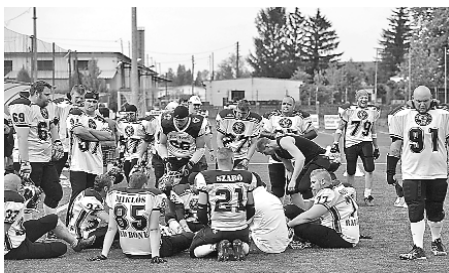
Kemény csata vár a Bad Bones csapatára