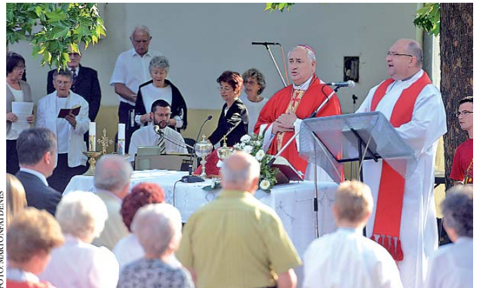
Ünnepi szentmise a Szent János és Pál kápolnánál