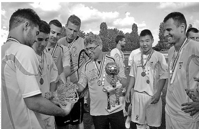
Éremosztó: bajnoki ezüst és kupaarany a szekszárdiak nyakában

-Mindannyiunkban van egy nagy adag keserűség – avatott be az öltözői hangulatba az UFC-ből stílusos NB III-as élcapatot fabrikáló edző, aki változatlanul maga mögött tudhatja a vezetés és a játékosok bizalmát. – Nem nagy dolgokon múltott, hogy most bajnokcsapata lehetne Szekszárdnak, amely a siker reményében léphetett volna pályára az NB II-ért is. Ha a városvezetés azonosul az elképzelésinkkel, fontosnak tartja az NB II-t, és támogatóként jobban mellénk áll, akkor már esetleg a télen tudtunk volna minden csapatrészebe legalább egy-egy meghatározó játékost igazolni, hogy ne fogyjunk el menet közben... Sajnos bekövetkeztek azok a sérülések, ami után az addig összeszokott védőnégyes tavasszal felbomlott, legalább ketten mindig hiányoztak, de sérülések hátráltatták a folyamatos jó teljesítmény elérésében két meghatározó támadókat is. Ezek után több mint elfogadhatónak ítélem a tavaszi eredményességünket, a második helyet. Meggyőződésünk ugyanakkor, ha csak a töredékét megkapjuk annak, amit