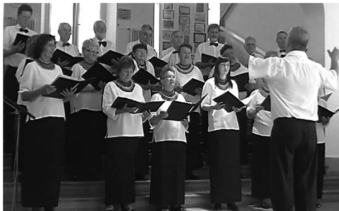
A Liszt Ferenc Pedagógus Kórus