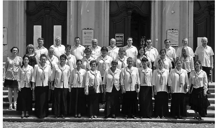
A Gárdonyi Zoltán Református Együttes

A Szekszárdi Gárdonyi Zoltán Református Együttes először a Balatoni Múzeumban lépett dobogóra egyházzenei kategóriában, az esti gálakoncerten pedig vastappsal jutalmazott műsort szólaltatott meg az énekkar a főtéri Magyarok Nagyszónya Plébánia templomban. Másnap