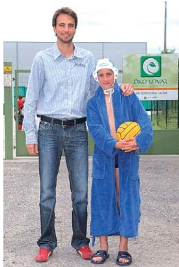
Júliusban a Vízmű SE vízilabdásainak gyűlik a pénz

A civil szervezetek támogatási sorrendjét egy-egy jelcs nap, vagy a szezonjelleg alapján határozták meg. Így került az első helyre a szekszárdi Ifjúsági Fúvószenekar, mivel június 21. a zene ünnepe. Az akció nem várt sikert aratott a lakosság körében, amelynek eredményeképpen rekord mennyiségű papír, műanyag, zöld- és alumíniumhulladék érkezett az udvarokba. Ezzel a cég júliusban 120.000 forinttal tudja támogatni a zenekart az általa meghatározott cél megvalósításában.