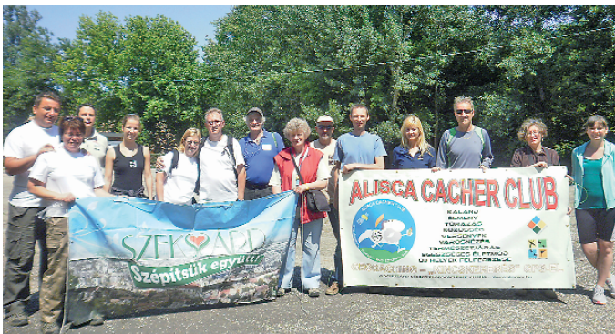
Népes csapat szedte a szemetet a Keselyűsi út mellett