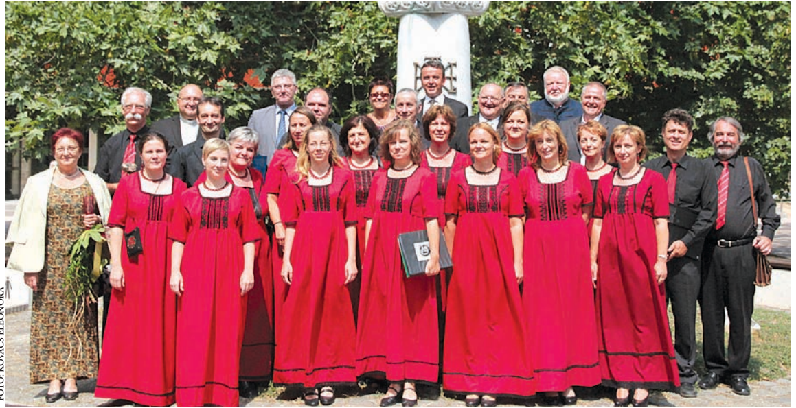
Az ideai kitüntetettek csoportja a Szent István szobor előtt

Az intelmek betartása a békére, békességre törekvéssel lehetséges - hangsúlyozta a polgármester, majd az ideai városi kitüntetetteket méltatta. Ahogy fogalmazott: a díjak azokat illetik, akik sokat tesznek városunkért, példát mu-