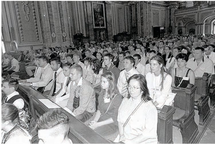
Az esküt tevők és az érdeklődők megtöltötték a belvárosi templomot

- Első szent királyunk abban is erényes volt, hogy nem csupán saját erejében bízott, hanem Istenbe vetette bizodalját - hangsúlyozta a plébános, aki arra is felhívta a figyelmet: húsz éve csökken a házasságkötések száma, s évente egy kisvárossal vagyunk kevesebben. Örömteli ugyanakkor, hogy az új kormány családpolitikája arra ösz-