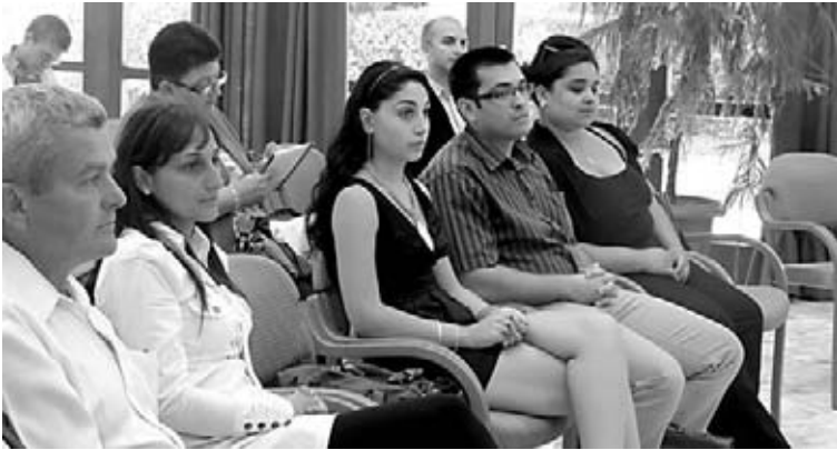
Segítenek és példát mutatnak a roma társadalomnak

A hátrányos helyzetűeket segítik a referensek