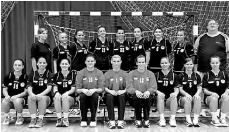
A Fekete Gólyák KC együttese Mohácson kezdi a pontvadászatot

A több fontos meccsről is hiányzott „Vasi” a szekszárdiak reményei szerint az ötödik fordulóra visszatérhet, de egy újabb szerkezeti gonddal már is szembe kell nézniük. A belső poszton, ahol egyébként sincs kellően