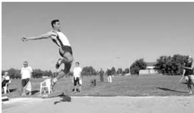
Zsivoczky-Pandel Attila 6,49 méterre repült távolugrásban