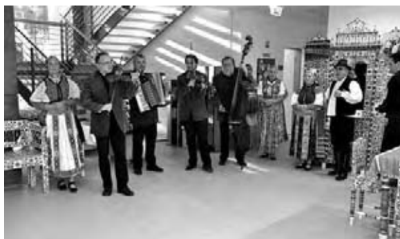
Részlet a kiállítás megnyitójából

A plafonig vetett ágyak hímezett, vagy szőttés-huzatú, illetve varrottas párnái csak úgy virítanak, az asztalok piros-ferhéz, szintén szőttés terítőit ugyanilyen