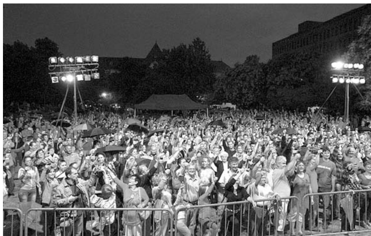
A Prométheusz parkban 3200-an koccintottak

Címét megőrizve 2013-ban is Szekszárd lett az ország legkedveltebb borvidéki települése a 25 ezer fő feletti kategóriában.