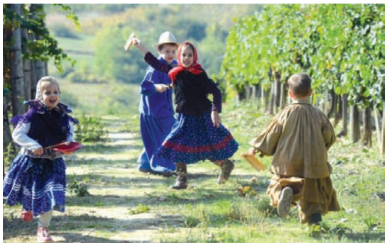
Hagyományos szüret: népviseletbe öltözött gyerekek kereplőkkel