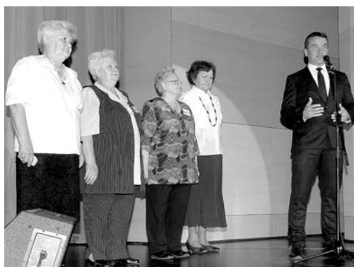
Nyugdíjas klubok vezetői a polgármesterrel

számait, a közönség egyre jobban oldódott. Egy pillanat alatt közvetlen kapcsolatot alakított ki a nézőkkel, táncolt, s minden manírtól mentes színpadi léte felidézte azt a Kovács Katit, akiért évtizedekkel ezelőtt ugyanez a közönség rajongott. A legszebb sláge-