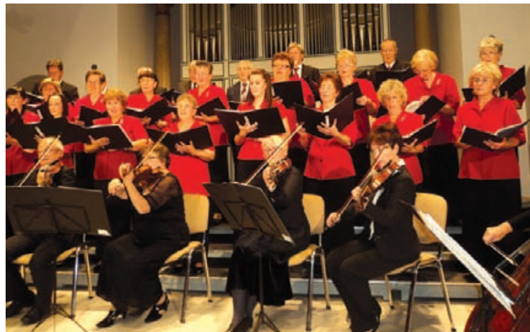
A pedagógus kórus és a kamarazenekar közös produkciója

A nap „megkoronázásaként” a Liszt Ferenc Pedagógus Kórus és a Szekszárdi Kamarazenekar adott ünnepi hangversenyt az Agóra Művészetek Házában. Az 1965-ben alakult Liszt Ferenc Pedagógus Kórus műsora igazán ünnepivé tette az estet: Halmos László: Minden földek című művét énekeltek