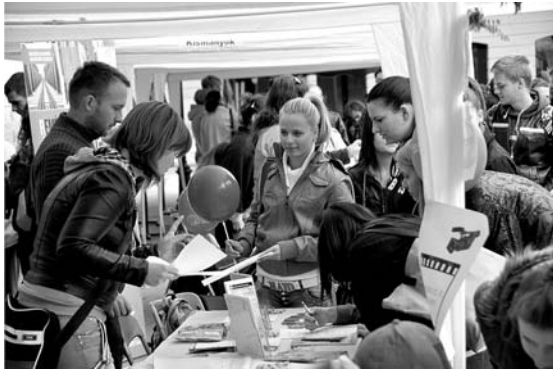
Sok érdeklődőt vonzottak a programok

A Pécsi Tudományegyetem Illyés Gyula Kara szeptember 18-án a Garay-téren rendezte meg hallgatói fesztiválját. Immáron negyedik éve élvezhetik az egyetem hallgatói, illetve Szekszárd város lakói a változatos programokban bővelkedő eseményt. A rendez-