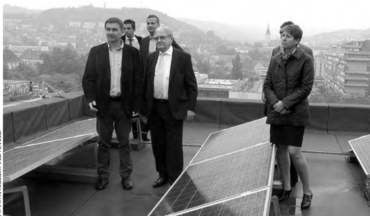
FOTÓ: A SZÉKSZÁRDI FELVÉTELE

A statisztika szerint Szekszárdon évi 1100 a napfényes órák száma, s vagyis ez a 11 kW-os napelem-park 12-13 ezer kilowattórányi áramot ad majd évente.