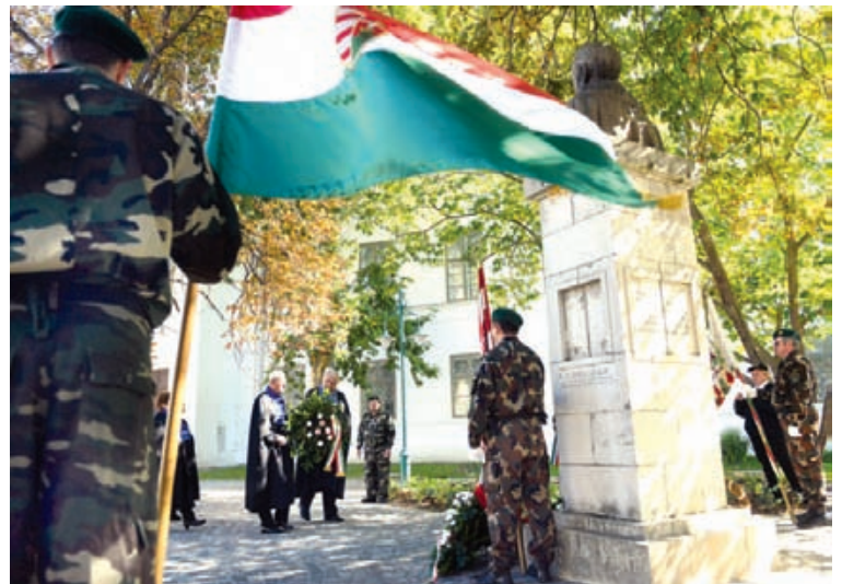
Bezerédj István szobránál zajlott az idei koszorúzás

Az emlékezők így többek között tudomást szerezhettek arról, hogy Aulich Lajos Horatius verseit olvasságta az ítélet végrehajtása előtti éjszakán, gróf Leiningen-Westerburg Károly az percegig becsületét védte feleségének írt levelében, gróf Vécsey Károly - akinek utolsóként kellett meghalnia - pedig a halott Damjanich Jánoshoz lépve, hoz-