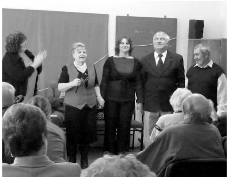
Az ünnepség zárásaként együtt énekeltek a sorstársak a fellépőkkel.