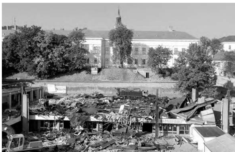
Eltűnt a szekszárdi vásárcsarnok felső része, az alsó szint megmarad

Az új piac a tervek szerint a jövő év szeptemberére készül el, az elárúsító helyek fedettek lesznek, így a kofák kevésbé lesznek kitéve az időjárás viszontagságainak. A hétről hétre jelentős forgalmat bonyolító piac az átépítés idejére a Liszt Ferenc térre költözött.