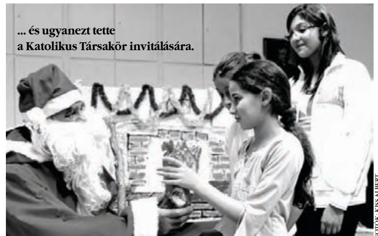
... és ugyanezt tette a Katolikus Társakör invitálására.