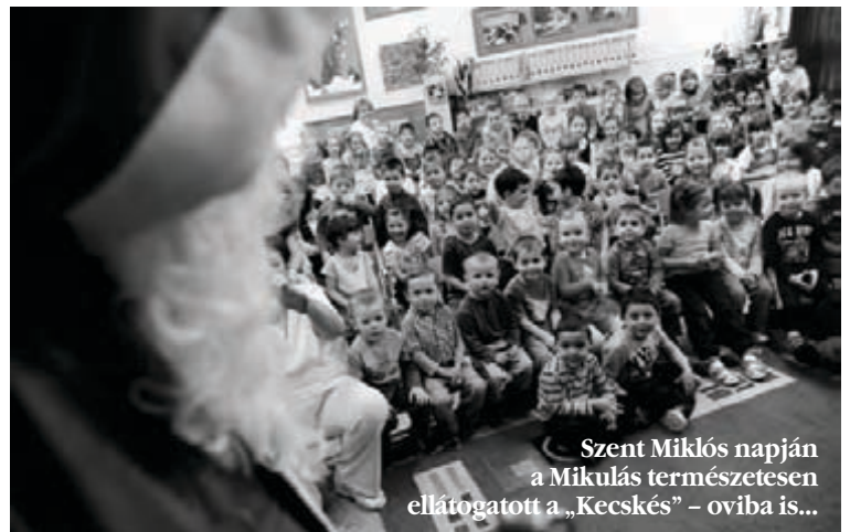
Szent Miklós napján a Mikulás természetesen ellátogatott a „Kecskés” – oviba is...