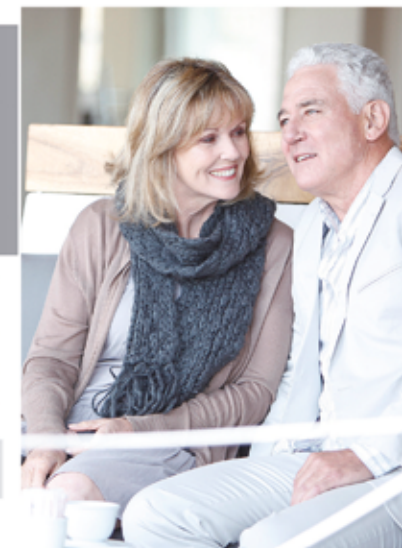
A hallókészülékek elfogadottsága érezhetően javult az elmúlt években.

A halláscsökkenés okozta következmények hallókészülék segítségével a legtöbb esetben orvosolhatóak, ennek ellenére manapság még mindig nagy az ellenállás az emberekben. Ahelyett, hogy segítséget kérnének, inkább elszigetelődnek, visszahúzódnak. Sajnos az is közrejátszik, hogy nem is olyan könnyű észlelni a tüneteket. „A halláscsökkenés általában lassan és fokozatosan jelentkezik, így egy megszokott állapottá válik, mely nagyban megnehezíti fel-