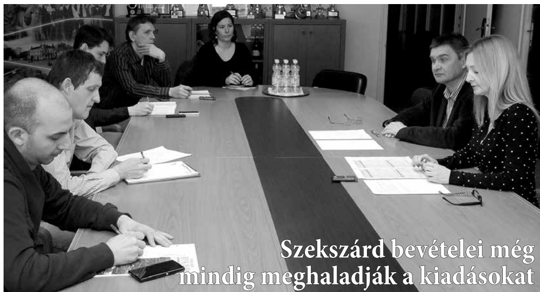
Szekszárd bevételei még mindig meghaladják a kiadásokat