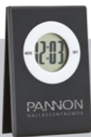
A készlet erejéig!

*amennyiben részt vesz ingyenes hallásszűrésünkön és amennyiben Ön elmúlt 50 éves.