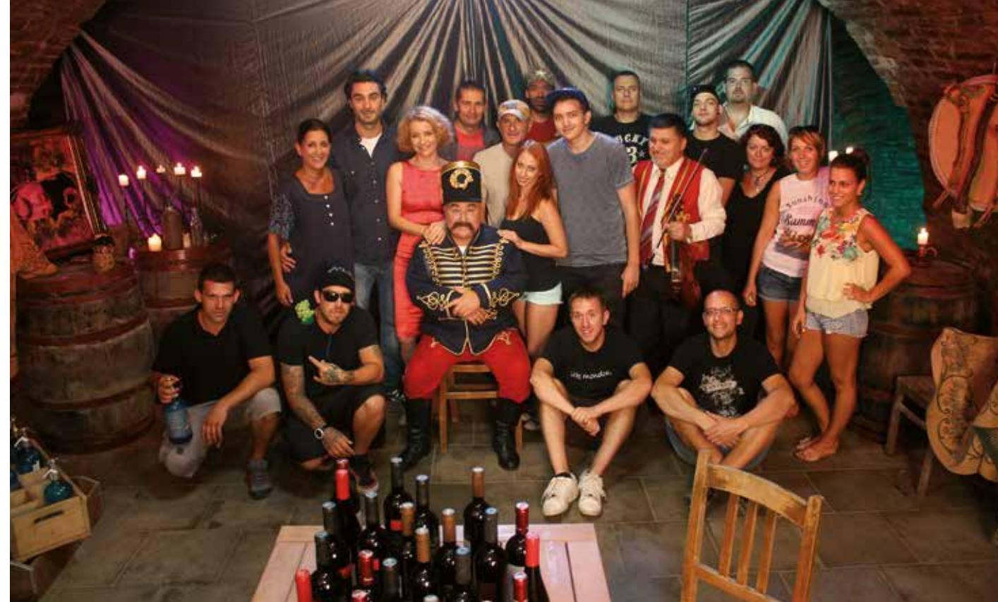
Az utolsó közös emlékkép a forgatásról

Filmesek lepték el Szekszárd utcáit az elmúlt hónapokban. Kamerák, világítástechnika, ismert és még ismeretlen színészek, színészpallanták. Az Obsitos megmozgatta Tolna megye székhelyét.