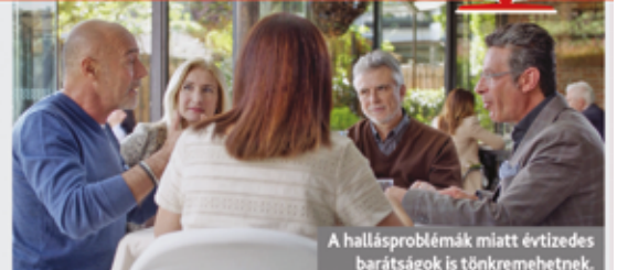
A hallásproblémák miatt évtizedes barátságok is tönkremehetnek.