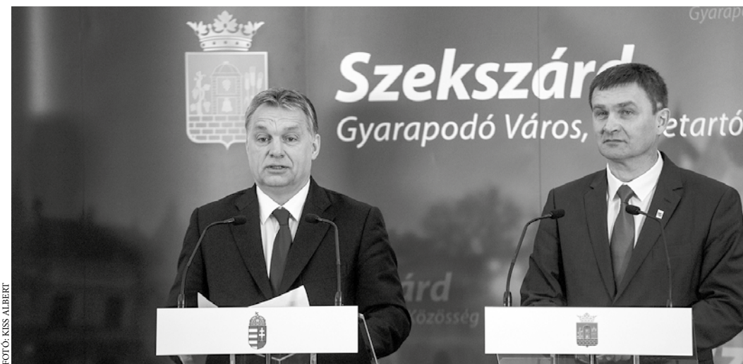
Orbán Viktor miniszterelnök és Ács Rezső polgármester közös sajtótájékoztatója

Orbán Viktor a Modern városok program keretében aláírt, több mint 33 milliárd forintos fejlesztési csomagról elmondta: az nem ajándék, hanem lehetőség, amiért a szekszárdi emberek megdolgoztak. A megállapodás részleteiről szólva elmondta: távhővezeték épül Pakstól Szekszárdig, amellyel az atomerőmű hűtővizét vezetnék el a megyeszékhelyre. A 10 milliárd forintos beruházással