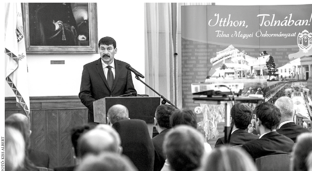
Áder János köztársasági elnök volt az emlékkonferencia díszvendége

A gátrendszert utoljára a tavaly lezárult Duna projekt keretében erősítették meg. A projekt során a folyó tizennégy árvízvédelmi szakaszán közel kétszáz kilométernyi töltést erősítettek meg, huszonöt műtárgyat és két árvízvédelmi központot hoztak létre, ami jelentősen hozzájárul az árvízi kockázatok csökkentéséhez. A több mint 28 milliárd forintból, részben uniós támogatással megvalósult Duna-projekt beruházásai 152 településen több mint fél millió embert érintettek, és legfontosabb célja az élet- és a vagyonbiztonság növelése volt.