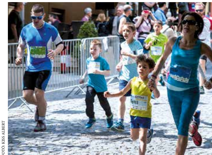
A gyerekeknek (és szüleiknek) 1 km-es versenyt rendeztek