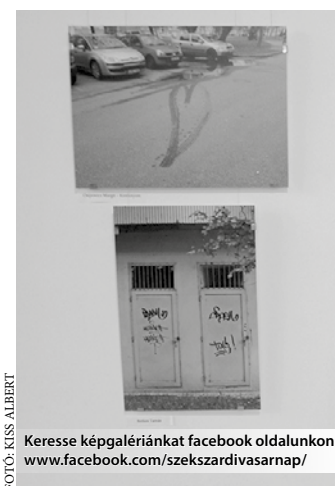
Keresse képgalériánkat facebook oldalunkon: www.facebook.com/szekszardivasarnap/

A tárlatot Kiss Albert fotóriporter nyitotta meg. A Szek-