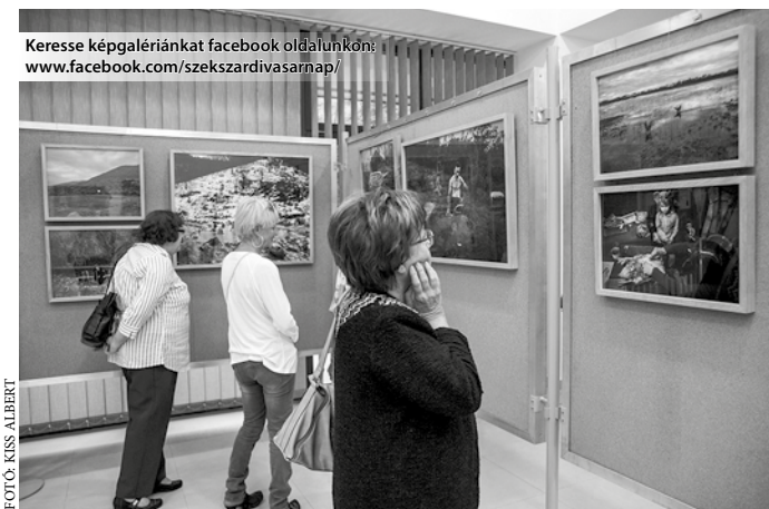
Keresse képgalériánkat facebook oldalunkon: www.facebook.com/szekszardivasarnap/

„A Pictorial Collective magyar fotóriporterek csoportja. Létrejöttét az motiválta, hogy olyan fotográfiai közösség alakuljon, amelyben a tagok egymástól függetlenül, de egymást inspirálva dolgozhatnak. Mi, a PC tagjai hiszünk benne, hogy a fotográfusok tanúk és hírvivők. Fontos számunkra a mindennapi helyzetek, különféle problémák bemutatása egyéni véleményemmel és látásmóddal” – mondja magáról a csoport, amelynek tagjai elhozták munkáikat Szekszárdra. A szakmá-