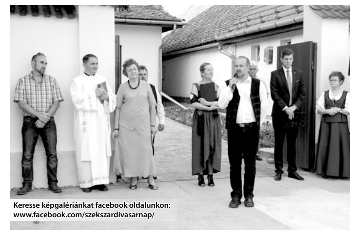
Keresse képgalériánkat facebook oldalunkon: www.facebook.com/szekszardivasarnap/

A kabinetfőnök emlékeztetett: a bukovinai székelység lelki örökséget, a szülőföldhöz való ragaszkodást hozta el Tolna megyébe. A II. világháborúban a Délvidékről menekülő családok összetartása példaértékű, kálváriájuk ellenére megma-