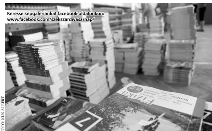
Keresse képgalériánkat facebook oldalunkon: www.facebook.com/szekszardivasarnap/