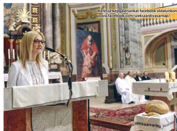
Keresse képgalériánkat facebook oldalunkon: www.facebook.com/szekszardivasarnap/