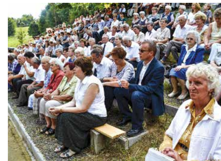
Keresse képgalériánkat facebook oldalunkon: www.facebook.com/szekszardivasarnap/