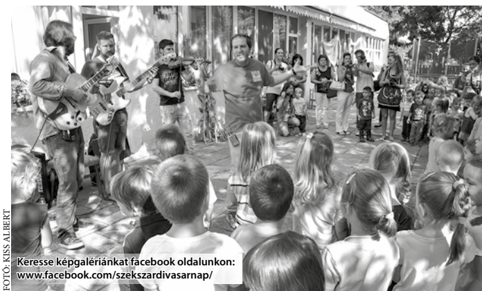
Keresse képgalériánkat facebook oldalunkon: www.facebook.com/szekszardivasarnap/

Idén szeptember 14-én került sor a hagyományos szüreti