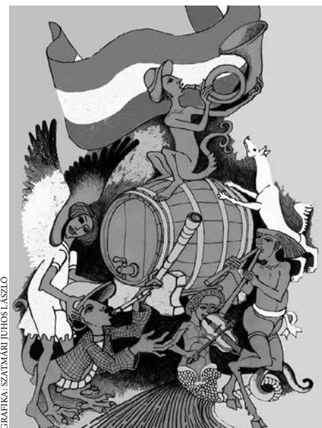
GRAFICA: SZATMARI JÁNOS LÁSZLÓ

adja meg Isten, ami erre rávisz, kerüljön pad meg asztal, s rá pohár is, és lüktessen benne, mint vér: a bor!