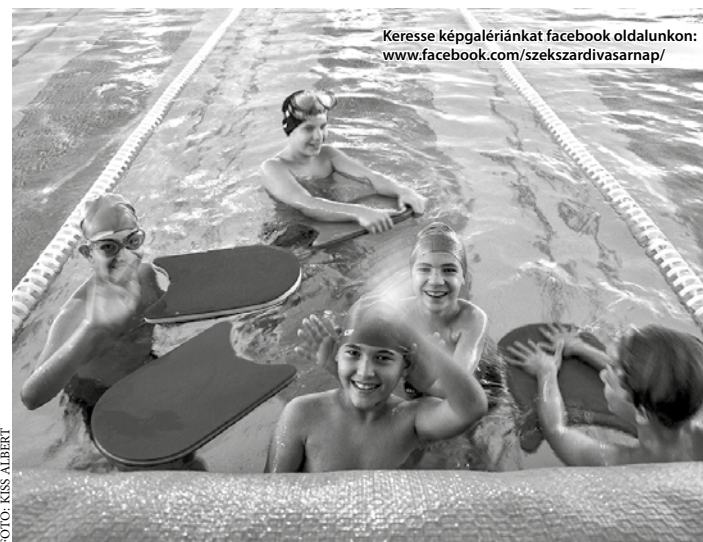
Keresse képgalériánkat facebook oldalunkon: www.facebook.com/szekszardivasarnap/

A tapasztalatok és visszajelzések alapján néhány változtatást azért eszközöltek: a 25 méteres, 8 sávú medencét nagyobb sátorral fedték le, így annak partján egy kis pihenő részt is kialakíthattak, ahol a különbö-