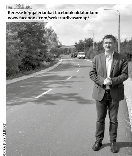
Keresse képgalériánkat facebook oldalunkon: www.facebook.com/szekszardivasarnap/

A fejlesztés közvetlenül mintegy száz családot, a környék tanyatulajdonosaival együtt viszont már körülbelül ezer szekszárdit érint. – Jól tudjuk, hogy a megyeszékhely nemcsak a belvárosból áll, a külterületeken is élnek szekszárdiak – mondta a polgármester, amikor arról számolt be, hogy a 350 millió forintból megvalósult útfelújítás mellett a belterületi határig kiépítik a közvilágítást is. A munkákkal várhatóan