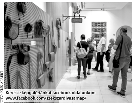
Keresse képgalériánkat facebook oldalunkon: www.facebook.com/szekszardivasarnap/

Hímzők, gyöngyfűzők, fazekasok, ékszerkészítők, fémművesek, bőrművesek: 21 alkotó csaknem kétszáz népművészeti alkotását tekintheti meg a közönség az I. Kortárs Népművészeti Triennálé keretében, a Művészeti Házában. A rendező Tolna Megyei Népművészeti Egyesület idén húsz éves. A szervezet ma is az alapításakor meghatározott célokhoz hűen tevékenykedik: „a magyarországi tárgyalkotó kézművesség hagyományainak felkutatása, megtartása, a nemzeti tárgykultúra értékeire épített, szakmai és esztétikai szempontból egyaránt hiteles kézműves, népművészeti, népi iparművészeti, iparművészeti tevékenység szolgálata és képviselése a jól használható és szép emberi környezet megteremtése” a cél. A tárlat, amelyet a megnyitón dr. Juhász Katalin néprajzkutató és Baky Péter festőművész ajánlott az érdeklődők figyelmébe, október 16-ig látogatható.