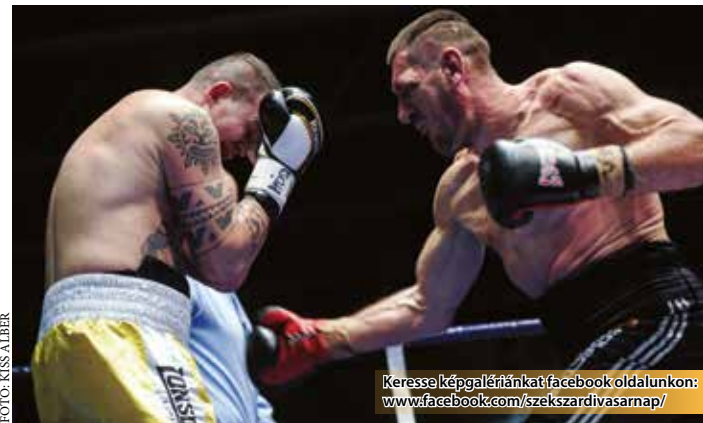
Keresse képgalériánkat/facebook oldalunkon: www.facebook.com/szekszardivasarnap/